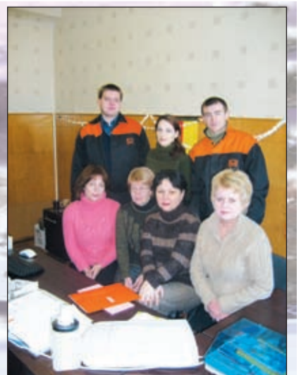
Коллектив работников отдела снабжения

Новый год обычно связывают с надеждами на лучшее, поэтому желаем, чтобы всё хорошее, что радовало нас в 2008 году, непременно нашло свое продолжение и в 2009. Пусть Новый год подарит всем благополучие, стабильность, исполнение заветной мечты, укрепит веру в будущее, а успех сопутствовал всем Вашим начинаниям. Смело открывайте первую страничку календаря 2009 года и принимайте от нас пожелания мира, согласия, терпения, добра, счастья, и, конечно же, удачи. С Новым годом!