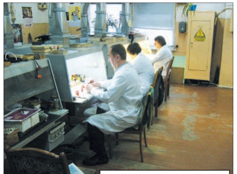
Коллектив за работой