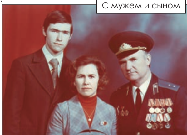
С мужем и сыном