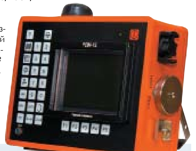
Каждый наш дефектоскоп - наша гордость. Наше стремление к совершенству.