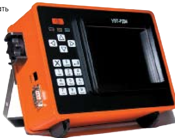
Лучший друг метролога: УЗТ-РДМ

Наше предприятие активно покоряет просторы Интернета: во второй половине октября стартует обновленная версия официального сайта РДМ. Также мы примкнули к